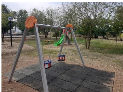
Parco giochi di Via Togliatti